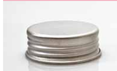
alluminio satinato satinized aluminium