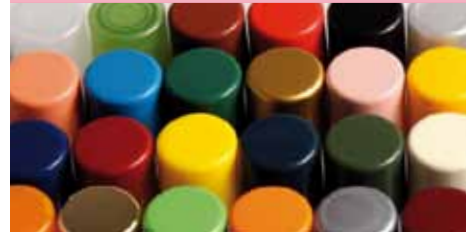
esempi di varianti cromatiche per tappi Millenium e Disco examples of chromatic variants for Millenium and Disco caps.