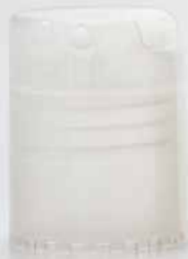
disk top incolore lucido transparent shiny disk top