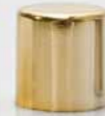
oro lucido shiny gilt