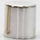
cromo lucido shiny chrome