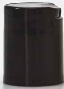
disk top nero lucido shiny black disk top