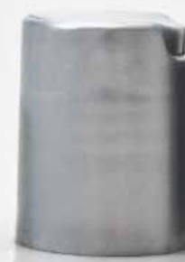
disk top argento satinato satinized silver disk top