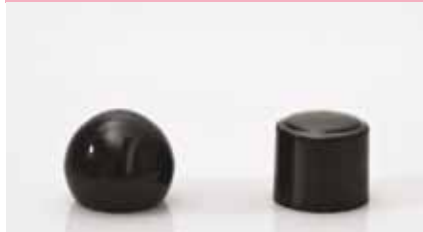
mini pallina nero lucido shiny black mini ball