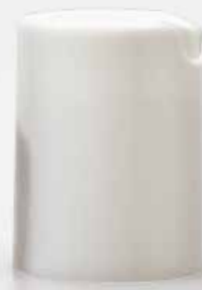
disk top bianco lucido shiny white disk top