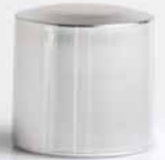
cilindrico grande cromato chromed big cylindrical